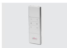
CONTROL BICANAL PARA CORTINERO