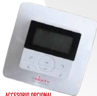
ACCESORIO OPCIONAL COD. 2312 Timer Empotrable Monocanal RF