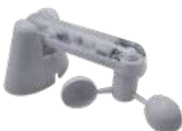
Sensor de Viento y Luz