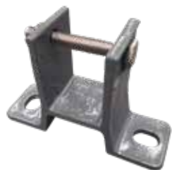
Soporte para Barra