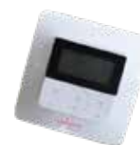
2312 Timer Empotrable Monocanal RF