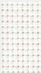
Chalk Ancho 2 | 25 | 3 mt.