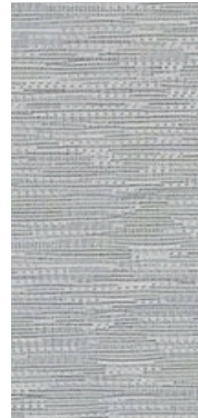
2106 Ligth Grey